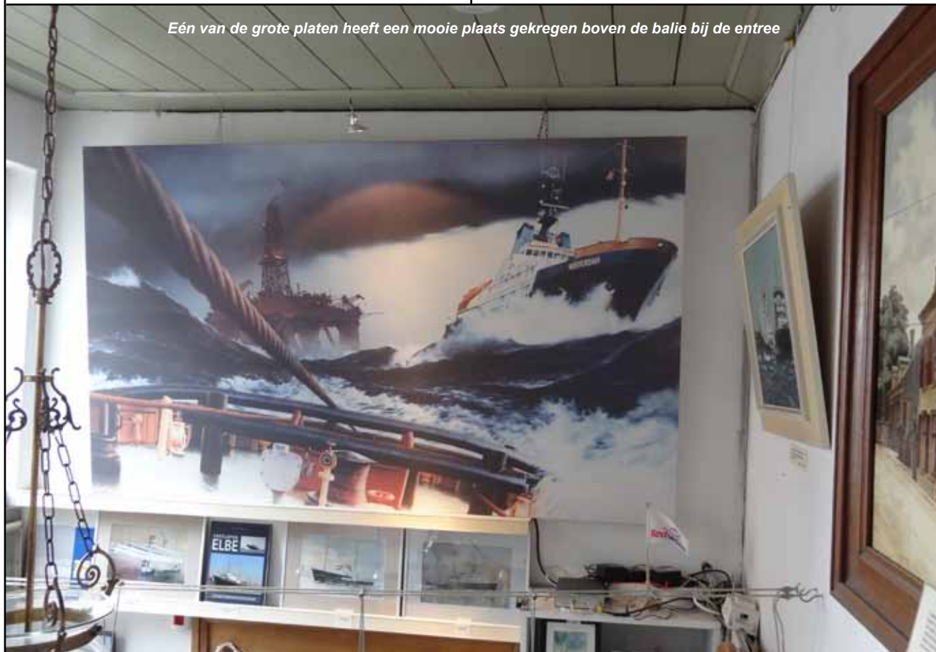
Eén van de grote platen heeft een mooie plaats gekregen boven de balie bij de entree

Delen van de schenkingen hebben we gelijk opgenomen in de tentoonstelling "Waar zijn ze gebleven?".