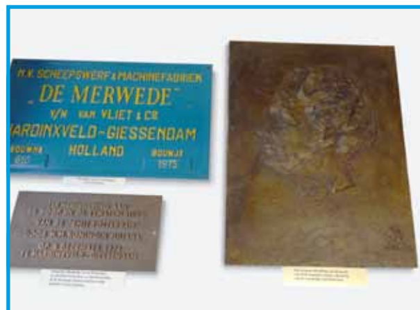
De plaquette en de werfplaat van de Smit Rotterdam

In het bijzonder zijn we erg blij met het bronzen portret van HM Koningin Juliana, dat vanaf het