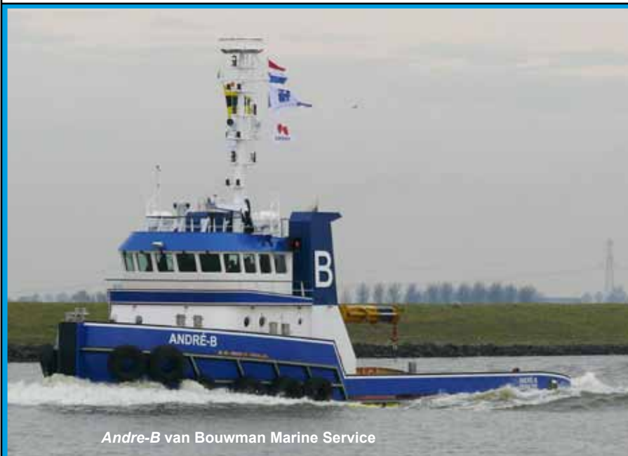
Andre-B van Bouwman Marine Service

tentoonstellingen de nadruk gelegen op de traditionele zeesleepvaartrederijen van nu en van weleer. Daarin willen we verandering brengen met de komende expositie. Wat velen zich niet realiseren is dat de sleepvaartwereld van nu niet meer alleen draait om Smit (is nu onderdeel van Boskalis), Wijsmuller (is overgenomen door Svitzer) of Doeksen (is nu uitsluitend veerbootrederij). Er zijn heel veel rederijen bijgekomen in Nederland, zonder dat het grote publiek, onze bezoekers dus, dat eigenlijk in de gaten heeft. Andere reeds bestaande rederijen zijn soms mèt, maar meestal zonder veel publiciteit uitgegroeid tot betekenisvolle