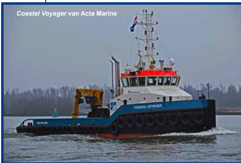
Coastal Voyager van Acta Marine